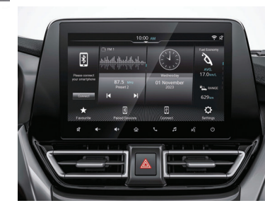
شاشة عرض 9 بوصة 9-inch Display Audio