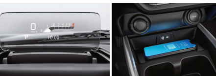
شاشة عرض أمامية Head-up Display