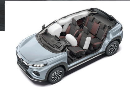
وسائد هوائية أمامية، جانبية وستائرية Front, Side and Curtain Airbags

فرونكس.. سيارة من الجيل التالي غير عادية تمنحك إحساس مختلف تماماً عن دون سواها. تصميم ديناميكي على غرار الكوبيه يجمع بين الرفق والقوة في آن، ما يجعلك ملفت للنظر أثناء قيادتها. عش إحساس فرونكس ولا تدع شيئاً يمنعك من أن تكون مختلفاً.