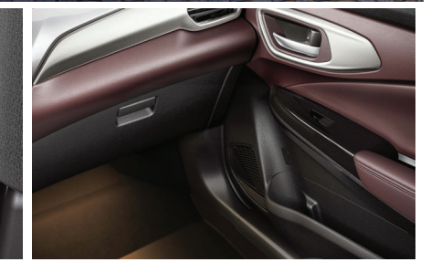
مصابيح للقدمين Footwell Lights