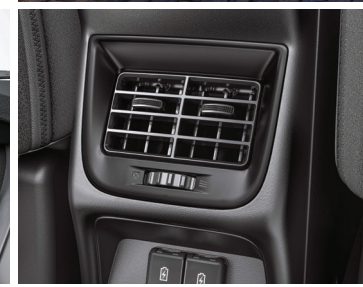
مفتحات تكييف خلفية ومقابس USB Rear AC Vents and USB Sockets